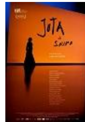
JOTA DE SAURA Director: Carlos Saura Tresmonstruos Media, Telefónica Studios, Movistar