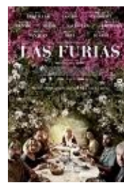
LAS FURIAS Director: Miguel del Arco Aquí y Allí Films, Kamikaze Producciones