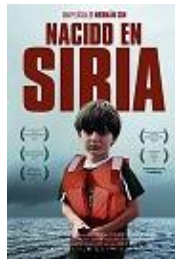
Director: Hernán Zin Contramedia Films (en coproducción)