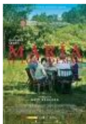
Avalon PC (en coproducción)