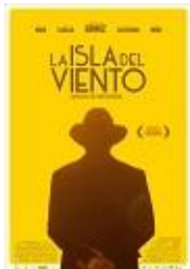
LA ISLA DEL VIENTO Director: Manuel Menchón MGC PC, SA