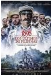
1898. LOS ÚLTIMOS DE FILIPINAS Director: Salvador Calvo Enrique Cerezo PC / CIFI Cinematográfica