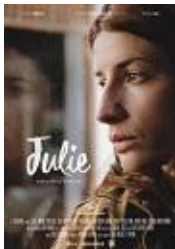
JULIE Director: Alba González de Molina El Gatoverde Producciones Cinematográficas