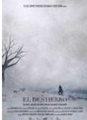
EL DESTIERRO Director: Arturo Ruiz Serrano T.L.C.A. Producciones, Africanauan