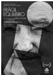
FRÁGIL EQUILIBRIO Director: Guillermo García López Sintagma Films