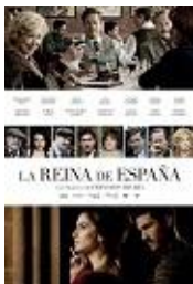
LA REINA DE ESPAÑA Director: Fernando Trueba Fernando Trueba PC / Atresmedia Cine