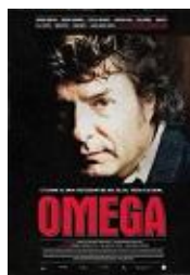
Telecinco Cinema, Universal Music Spain