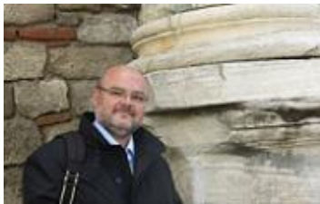
CRÍTICA DE "MATAR A UN NIÑO" DIRIGIDO POR LOS HERMANOS ALENDA